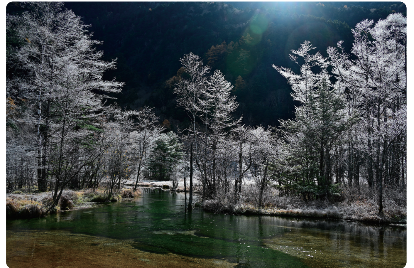
[上高地 田代池]